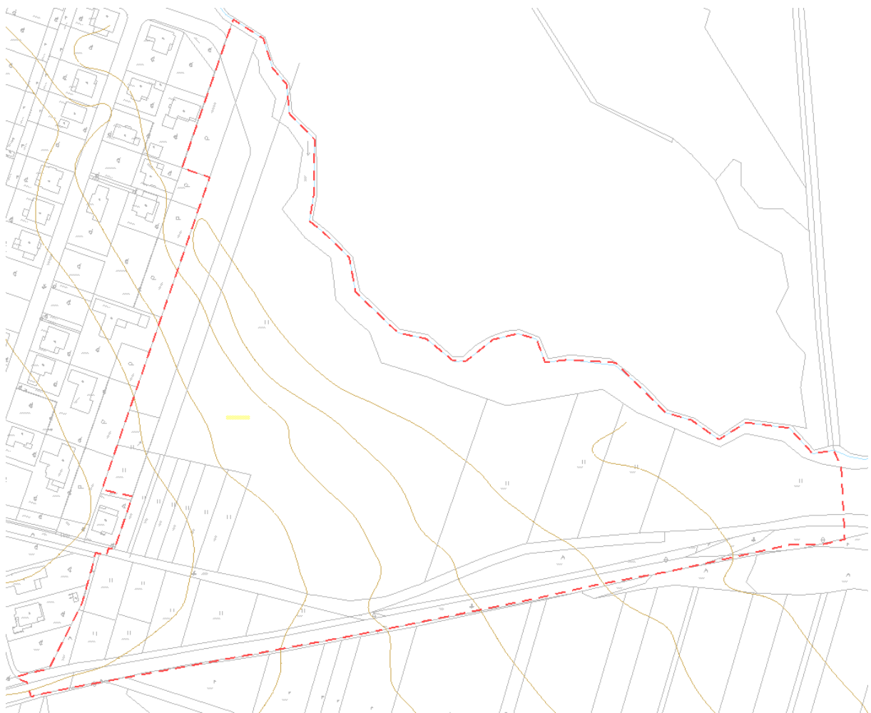
Obr. 1 Vymedzenie riešeného územia na podklade katastrálnej mapy – reg. C (červená čiarkovaná čiara)

Záujmové územie pre riešenie širších vzťahov vymedzujeme v okruhu 100 m od hranice riešeného územia zóny.