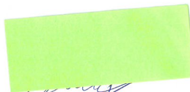
Dis. art. Peter Bielický